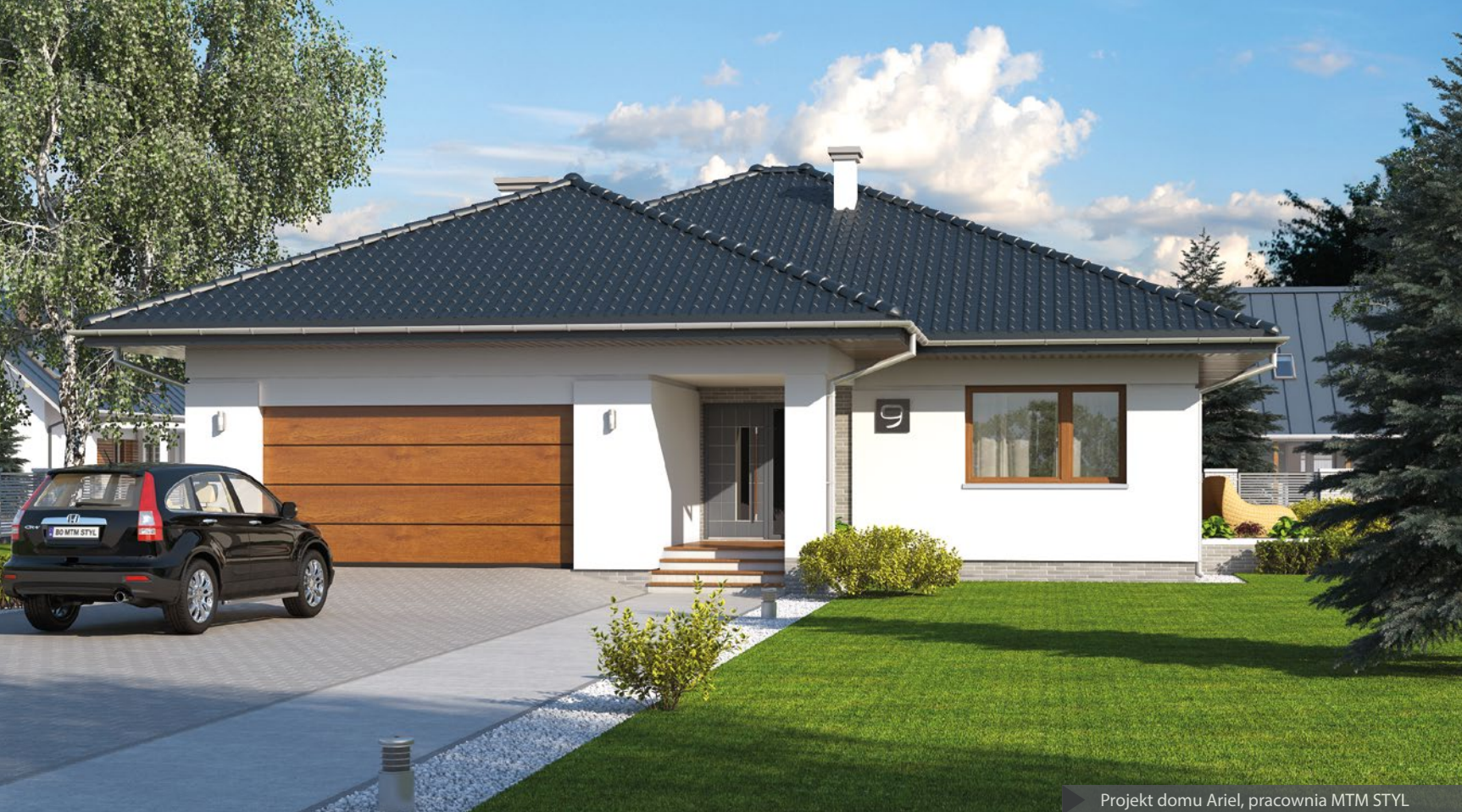
Projekt domu Ariel, pracownia MTM STYL