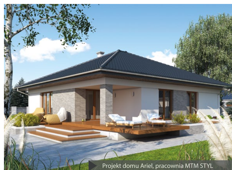
Projekt domu Ariel, pracownia MTM STYL

Wybór projektu domu to jedna z najważniejszych decyzji, jakie stoją przed inwestorem. Jest to pierwszy etap, który należy pokonać na drodze do realizacji marzeń o własnych czterech kątach. Ta decyzja niesie za sobą szereg następstw, ponieważ to, jaki projekt wybierzemy, definiuje przebieg późniejszych prac budowlanych, a w dalszej perspektywie również komfort życia przyszłych domowników. Obecnie można zaobserwować pewien trend wśród inwestorów indywidualnych, którzy dokładnie planują każdy etap budowy, realnie oceniają swoje możliwości finansowe, a przy wyborze projektu konfrontują je z wymaganiami swojej rodziny. Dom budowany z uwzględnieniem tych wszystkich aspektów to dom idealnie dopasowany – odpowiadający indywidualnym potrzebom wszystkich członków rodziny.