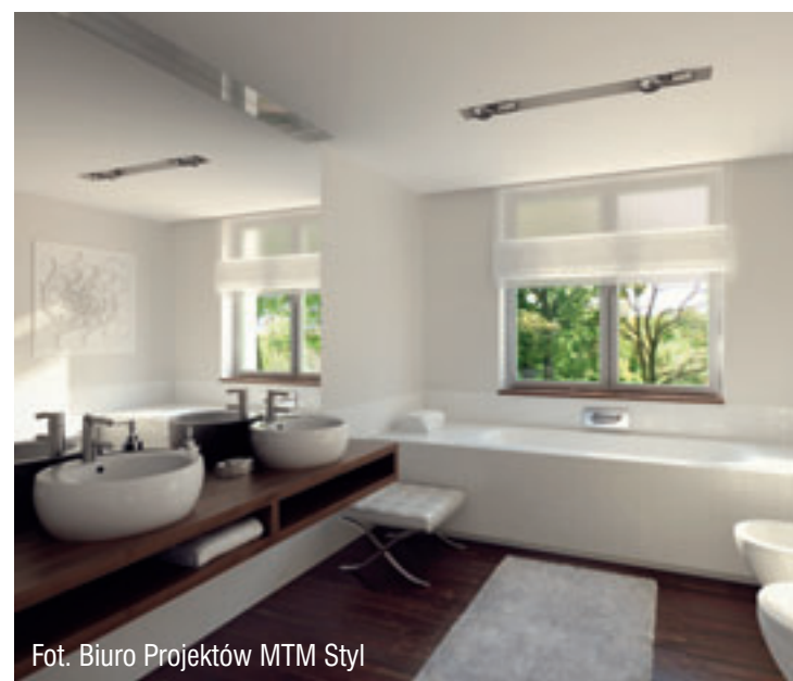
Fot. Biuro Projektów MTM Styl