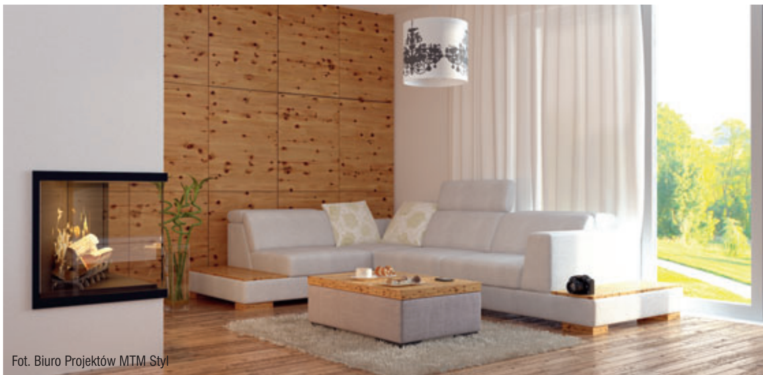
Fot. Biuro Projektów MTM Styl