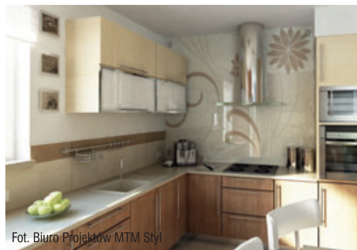
Fot. Biuro Projektów MTM Styl