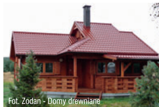
Fot. Zodan - Domy drewniane