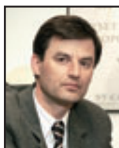
arch. Tomasz Sobieszuk, Biuro Projektów MTM STYL, www.domywstylu.pl

Szyper 6 dr-S to stosunkowo niewielki dom letniskowy, który wyróżnia się na tle projektów konkurencyjnych niebanalną i charakterystyczną bryłą. Popularność projektu bierze się stąd, iż na niewielkiej powierzchni 49 m 2 udało się zaprojektować funkcjonalną przestrzeń, która z powodzeniem zapewni wygodę i wypoczynek trzy-, a nawet czteroosobowej rodzinie.