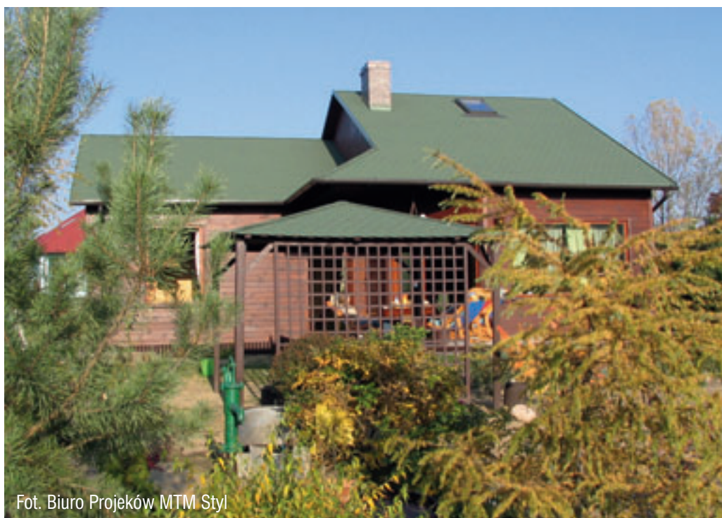
Fot. Biuro Projektów MTM Styl